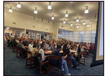
Senior Info Night