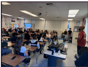
Noche de información para 12º grado

¡Revisen las fotos de acción de los eventos a continuación!