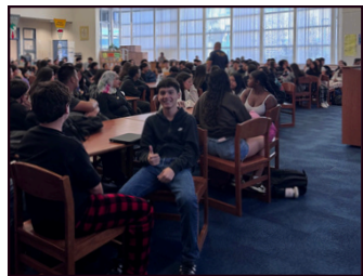
9th Grade Presentation

The fall was a busy time for our Counseling department. We hosted Senior Info Night to provide an overview of senior year to 12th grade students & their parents, our Parent Partnership Academy Sessions for 9th, 10th & 11th grade parents, and Senior Evaluations where we met with every senior to review their transcripts, graduation status and post-high school plans! We also met with all 9th graders to review high school graduation requirements and complete a career interest assessment! This helped students discover the type of work activities and occupations they may like and find exciting. Check out action shots from all those events below!