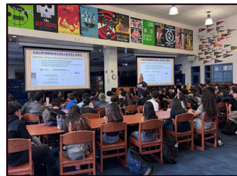
9th Grade Presentation