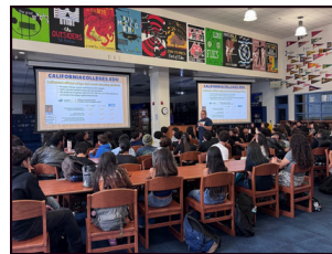
Presentaciones del 9º grado